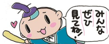
イラスト by マメさん