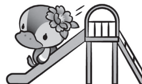
(江東区観光キャラクター) コトミちゃん

【入園申込書の受付】 <!注意!> 申込は1幼稚園に限ります。重複申込はすべて無効とします。