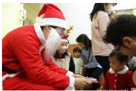
プレゼントを持ったサンタさんの登場にびっくりするこどもたち