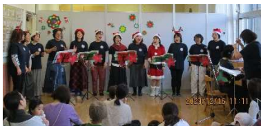
現役のみずべママと先輩ママ達で構成される うたい隊♡

12月16日(土)ひろばで行われたクリスマス音楽会。50組を超える沢山の方々遊びに来てくれました!当日はスタッフのハンドベルの音色から幕開け。南砂児童館のスタッフも駆けつけてくれ、歌に合わせてクリスマスの可愛いパネルシアターを演じてくれました。メインはコロナ禍も毎年クリスマスソングの動画を届けてくれていたうたい隊のステージ!隊員のお子さんの小学生サンタも登場してのダンスあり。手作り楽器が配布され、会場のこどもたちも皆で音を鳴らしてノリノリになる1曲も。素敵な歌声に包まれ、一足早いXmasを楽しみました。