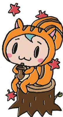
イラスト by マメさん

9月30日(木)、自然と遊ぼうのプログラムを行いました。マザーツリー自然学校の中安さんと一緒に、子ども達の目線で見つけられる、草花やだんご虫を探しました。茂みの中から見つけたのは、つるの端っこ。みんなで大きなかぶの様に「うんとこしょ！どっこいしょ！」と引っ張りました。つるの先には、何もなかったけれど、プチンと切れたつるを見て、「やったー！」と喜んでいました。