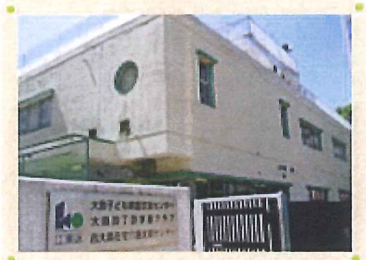
大島四丁目団地の敷地内にあります